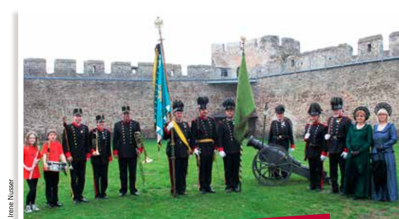
Das 220-jährige Jubiläum feiert das Privilegierte uniformierte Bürgerkorps Eggenburg, der älteste Verein des Bezirks Horn, am Pfingstmontag, den 9. Juni um 9.30 Uhr in der Pfarrkirche St. Stephan in Eggenburg.

Das Privilegierte uniformierte Bürgerkorps Eggenburg feiert am Pfingstmontag, den 9. Juni 2014 ein ganz besonders Jubiläum: Das 220-jährige Bestehen des Vereins. Unglaublich aber wahr, als der Verein vor 220 Jahren gegründet wurde, war der 9. Juni 1794 ebenfalls der Pfingstmontag. Damals wurde im Rahmen eines Hochamtes in der Kirche St. Stephan der Grundstein für den nun ältesten Verein im Bezirk Horn gelegt. Aus diesem Grund lädt das Bürgerkorps Eggenburg die Bevölkerung ein, am Pfingstmontag, 9. Juni 2014 gemeinsam eine Jubiläumsmesse um 9.30 Uhr in der Pfarrkirche St. Stephan zu feiern. Im Anschluss an die Messe zieht der Festzug auf den Hauptplatz, wo es eine Agape mit Brot und Wein geben wird. Das Privilegierte uniformierte Bürgerkorps Eggenburg freut sich darauf, mit Ihnen seinen 220. Geburtstag zu feiern.